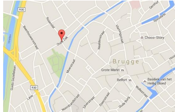
Oude Zak: de gekste straatnaam van Vlaanderen

Een Nederlandse bewoner van de Oude Zak is best tevreden met de naam van de straat. Vooral Nederlandse toeristen vinden de dubbele bodem van de straatnaam leuk. Er wordt weleens gegrapt dat je alleen in de Oude Zak kunt wonen als je een oude zak bent.